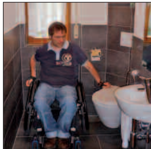
Aus einem für einen Rollstuhl unzugänglichen WC wird ein Raum, der neben der Toilette genügend Raum bietet und so einem Rollstuhlfahrer den selbstständigen Toilettengang ermöglicht.

90 Zentimetern nicht unterschreiten. Falls es die Planung unbedingt erforderlich macht, kann auch eine lichte Breite von mindestens 80 Zentimetern vorgesehen werden.