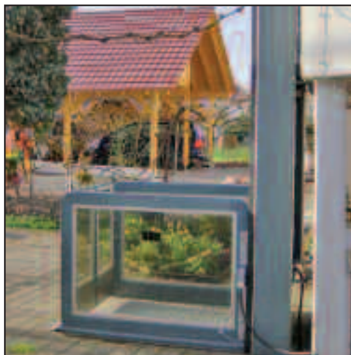
Mit einem Plattformlift, der mit dem Rollstuhl befahren werden kann, können bisher unüberwindliche Höhenunterschiede bewältigt werden.

Nachfolgend werden einige Maßnahmen zum barrierefreien Bauen und Wohnen aufgezeigt. Diese sind nach den Bautypen Ein-/Zweifamilienhaus oder Mehrgeschosswohnungsbau unter Berücksichtigung unter-