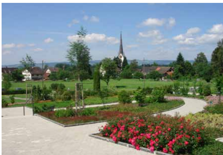
Bei diesem Friedhof wurde alternativ eine Wegführung zu den Treppen gestaltet.

Friedhöfe erfüllen wichtige und in jeder Kultur bestehende individuelle und kollektive Funktionen. Vor allem sind sie dazu bestimmt, den Angehörigen Verstorbener ein ungestörtes Totengedenken zu ermöglichen. Das Ergebnis soll für alle Besucher, ein individuell nutzbarer und gut zugänglich gestalteter Friedhof sein, der die Interessen verschiedenster Zielgruppen widerspiegelt.