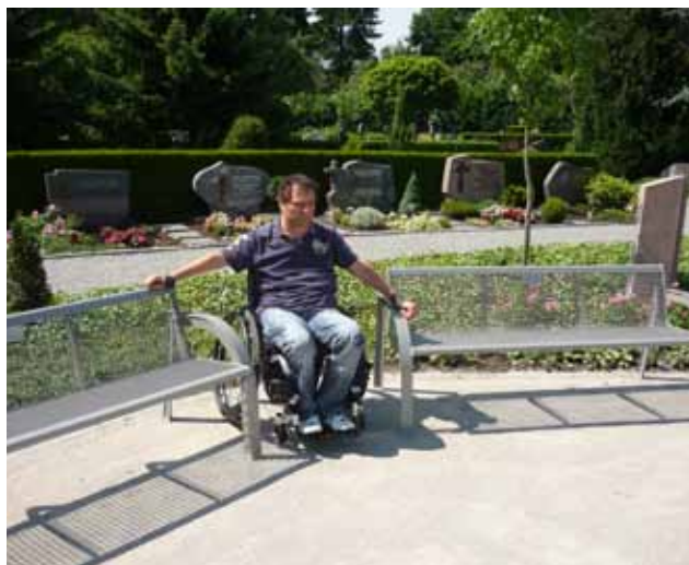
Bei Sitzgelegenheiten sollte auf Stellflächen für Rollstuhl, Rollatoren oder Kinderwagen geachtet werden.

Eine Integration in den Bereich der vorhandenen Sanitäreinrichtungen wäre zwar wünschenswert, ist jedoch bei älteren Gebäuden aufgrund der beengten Flächen nicht immer möglich. Diesen Umstand haben wir oft aufgrund einer historisch gewachsenen Bauform und Friedhöfe gehören nun mal oft zu den ältesten Objekten innerhalb einer Stadt