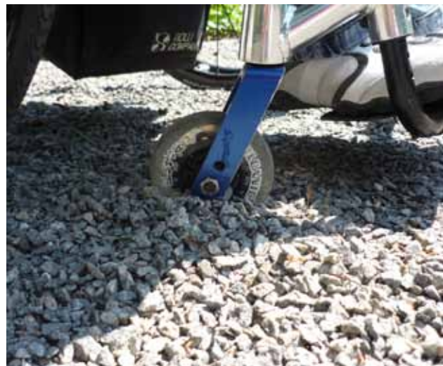
Zuviel Kies erschwert das Befahren mit Rollstuhl und Rollator.

se eine lange Lebensdauer. Wichtig ist, dass solche Wege fachgerecht eingebaut, gut verdichtet und gut entwässert werden müssen. Eine Sicherung der Weggeränder durch Kantensteine verhindert Abbrüche und Gefahrenstellen gerade in abschüssigem Gelände.