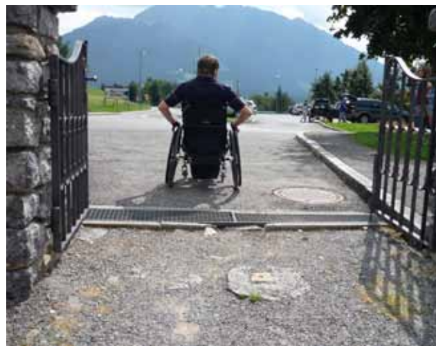
Derartige Bodenbeschaffenheiten sollten beseitigt werden.

Gleichzeitig sind Kantensteine eine gute Orientierungshilfe für blinde oder seheingeschränkte Fußgänger.