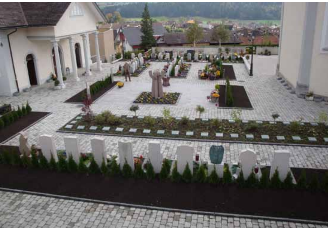
Die Zugänglichkeit sollte auf dem ganzen Friedhof sowie deren Gebäude gewährleistet sein.

währleistet werden kann oder wo eine starke Beanspruchung durch Fahrzeuge stattfindet.