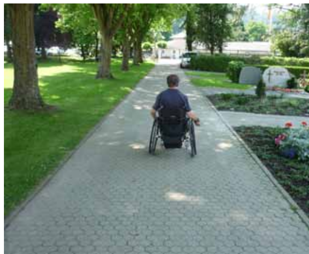
Gut befestigte Wege mit Pflastersteinen oder wassergebundenen Belägen erleichtern das Befahren.