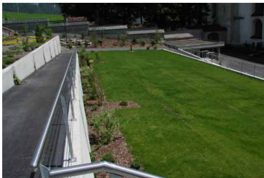
Bei derartigem Wegverlauf empfiehlt sich immer auch ein Geländer mit Handlauf, auch präventiv als Absturzsicherung.